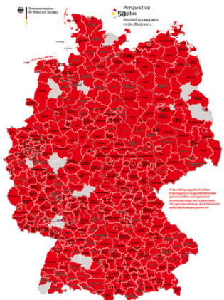
Das Bundesprogramm »Perspektive 50plus«

Ein Projekt der Jobcenter Müritz, Demmin und Ostholstein im Rahmen des Bundesprogramms Perspektive 50plus