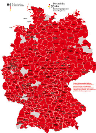
Das Bundesprogramm »Perspektive 50plus«

„Zusammenkommen ist der Anfang. Zusammenarbeit ist der Erfolg.“ Henry Ford